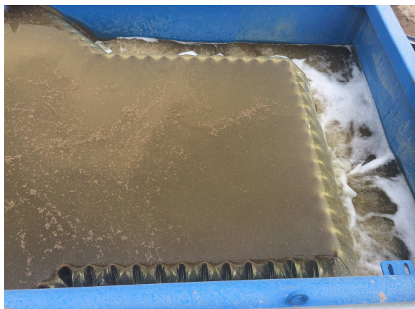
Stufe IV: Wasser das zur Filterpresse geht und wir Reinigen