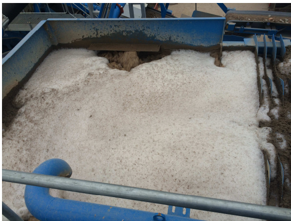
Stufe 1: Rücklaufwasser aus Anlage verschmutzt

Waschanlage, Sedimentationstank und Flockungseinheit: