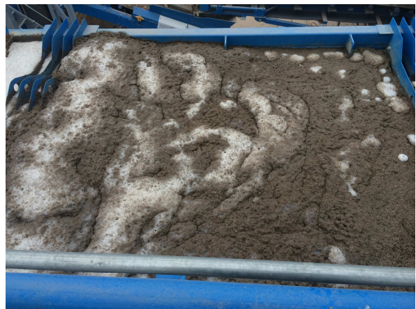
Stufe II: Zugabe von Flockungsmittel