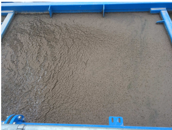
Stufe III: Sedimentation